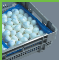
Polybeutel in Mehrwegkrate