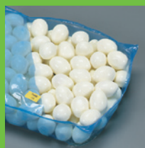
Polybeutel im Karton